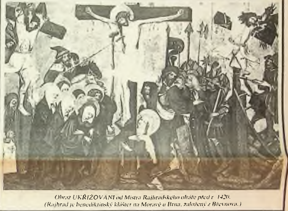
Obraz UKŘÍŽOVANÍ od Mistra Rajhradského oltáře před r. 1420. (Rajhrad je benediktinský klášter na Moravě u Brna, založený z Břevnova.)

Klokotem hlaholí zvony v okol- ních dědinách a bublavými vln- ami jako by se slivaly sem do zapadlého úvalu, kde mrou a v němotu se ztrácejí jako dlouho a stále mírněji a mírněji šeptající ozvěny. A všude, kolem dokola po všech širokých končinách Moravy zvony tak svým tlukotem volají jako ovečky poslušný a věrný svůj lid, všude, po všech končinách země, po všem okruhu zemském v tu chvilu v chrámu Boha svého vzývá křesťanský, za hlaholu zvonů k oltáři se ženoucí, do prachu země padající, do prsou hlasnými údery bijící se katolíci. Celý ten obraz v prachu před Bohem kořícího se lidstva jako by letem zamihnul se ozářenou lesinou. - Tu doubrava začínala krásný svůj život vonnými výd- echy, provívajíc stíny zase svých a ještě velebnějších katedrál. A všude to tiché ticho, velké, světlé ticho svátečního dne.... A jen ten les šeptal zmatenými rty, jak jen v bílých, čistých svých snech blouznívá duše nevinná. Jak zlaté hvězdičky u pohou, na půdě zetlelé zimou probleskují