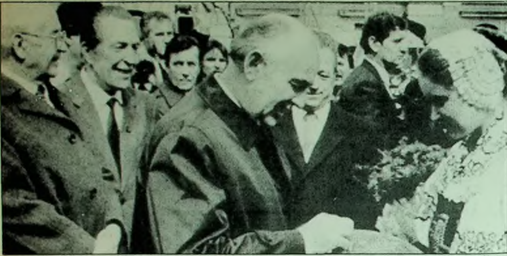
Po příjezdu na pražské Hradčany, vítali najednou soudruha M. Gorbačova tradičně: chlebem a solí. G. Husák - čs. šéf komunistů a prezident stojí vlevo za ním. (viz dnešní Sloupek informací)