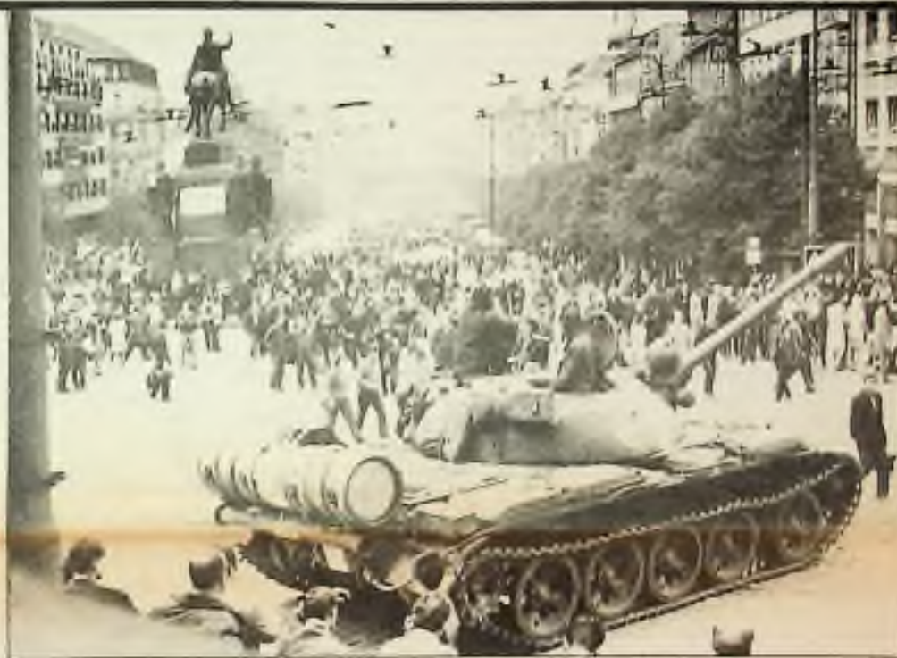
Záběr z horní části Václavského náměstí v Praze v den sovětské zrádné okupace Československa 21. srpna 1968 - na potlačení demokratických reform „Pražského jara“, které soudruh Brežněv násilně potlačil.

Lidé se tlačili a vystupovali na špičky, aby mohli osobně aspoň spatřit prvního komunistu z Moskvy, který se dovede lidsky