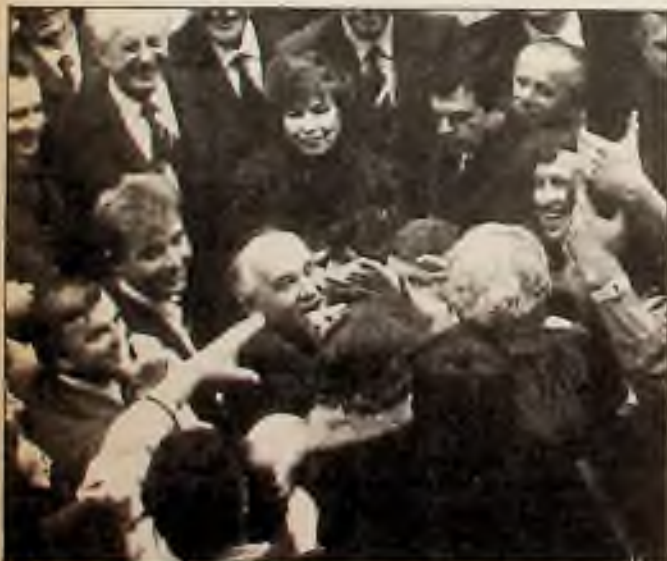
Po devatenácti letech Husákovy t.zv. normalizace na témže Václavském náměstí v Praze - ale až dolů „Na Můstku“ - je třetí Brežněvův nástupce Michail Gorbačov radostně vítán v naději, že jeho „glasnost“ je první „vlastovkou“ nového jara větší svobody.

Existují však některé podobnosti mezi Dubčkovými a Gorbačovými reformami. Dawisha řekl, že za Dubčeka existovalo - stejně jako za Gorbačova existuje - živelné vědomí o nutnosti reform, přesvědčení o potřebě toho, aby vůdčí role zastávali odborníci a nikoliv neschopní privilegovaní straníci, a zdůrazňovala se potřeba demokratisace a otevřenosti. Dnes však naléhání na provedení reform přichází přímo z Moskvy, vyc- (Dokončení na str. 6)