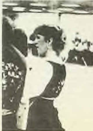
ČESKÁ LIDOVÁ TANEČNICE Z TEXASU

Píseň jistě typická pro velké oči vyhládkových moravských vesniců, Iržnýchých bidou, vrchnosti a policajty. Rovněž typické ale je, že jejich už dávno nehlaví a policii netýráni potomci, zpívají refrén stejně nadšeně a veřejně, jako je asi zpívali vystěhovalci, asi potají a asi — přes ten optimismus — s počty obava úzkosti. Nebudu tvrdit, že texaské pěvecké soubory mají vysokou profesionální