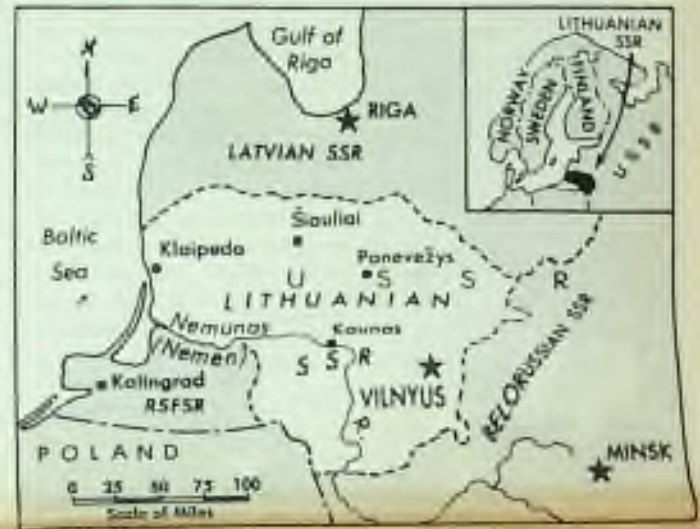
MAPA LOTYŠSKA A LITVY. z níž si Stalin zároveň s Estonskem udělal sovětské republiky.

Podle zprávy rozhlasu „Radio Free Europe“ - u příležitosti letošních oslav obrácení Litvy ke křesťanství - protináboženská kampaň nabyla zcela zvláštní povahy. Učastní se jí totiž nejen také sovětský dějepisci a protináboženské propagandisté. Překotem jsou psány a vydávány knihy, brožury a jiné tiskoviny, ve kterých se tvrdí, že katolická církev neměla a nebyla obhajkyví kulturního