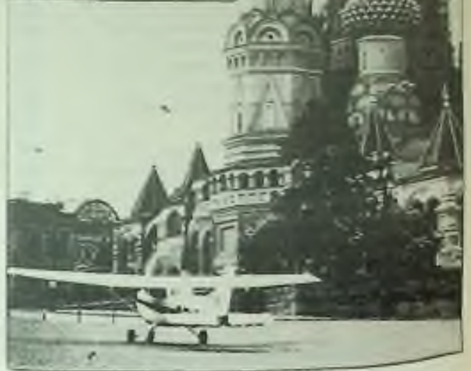
Letoun Cessna typu 172 B, v němž západoněmecký 19letý letecký amatér doletěl „klidně - píďo“ - z Finska do SSSR a přistál na Rudém náměstí v Moskvě.

velitel sovětského letectva maršál Alexander Koldunov - byli ihned zbaveni svých funkcí, údajně kvůli nechalosti a zanedbání svých povinností. Čeká se, že ještě další členové sovětské vojenské elity budou ze stejného důvodu rovněž zbaveni svých funkcí. Novým ministrem obrany se stal jinak málo známý generál Dmitri Yazov.