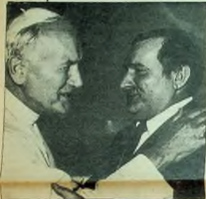
Osobní setkání ve čtvrtek 11. června 1987 v polském Gdaňsku s Lechem Walesou, zakladatelem zakázaných svobodných dělnických odborů „Solidarita“, zůstane dozajista historickým mezníkem 20. století v boji polského věrického národa za svobodu proti totalitě bezbožického komunismu.

Saturday June 20, 1987 (Sobota 20. června 1987)