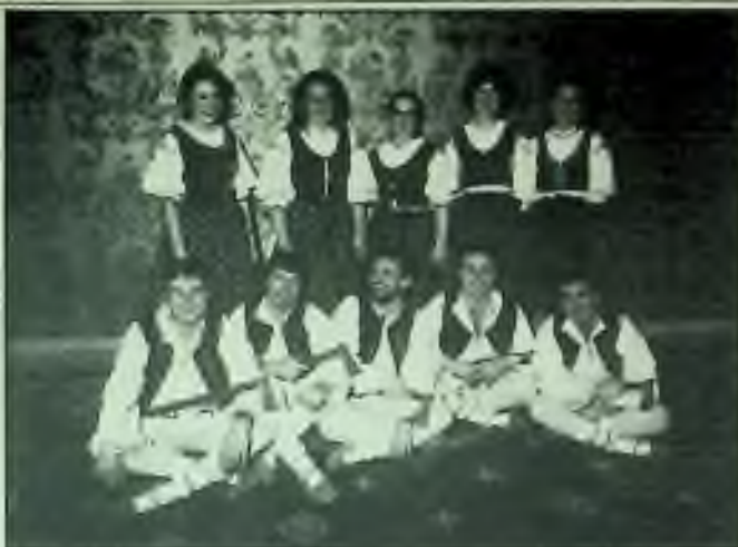
Taneční skupina Beseda/Domov