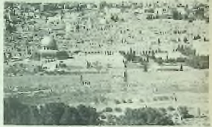
Jeruzalém - hlavní město dnešního státu Izraele - s Osmarovou mešitou muslimů - (kapole vlevo) - zbudovanou nad obětní skálou Abraháma - praotce Židů i Arabů - zůstane zřejmě po dlouhá další léta „kamenem úrazu“ vzájemného lidského porozumění a tolerance.