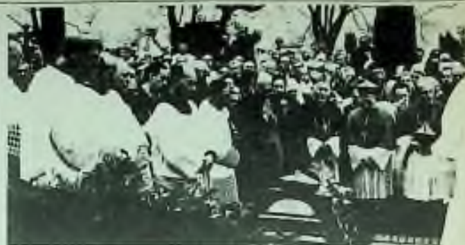
Poslední rozloučení. Vpředu před rakví tři kardinálové: WOJTYŁA (Krákov), KÖNIG (Vídeň) a BENSCH (Berlín). Kard. WOJTYŁA zdůrazňuje pravě a krátkém proslovu »mučednický« charakter zesnulého.

Trápí mne zvláštní pocit studu, když se občas dovím, kolik lidí po straně hubovalo na ten nebo onen článek a nakonec