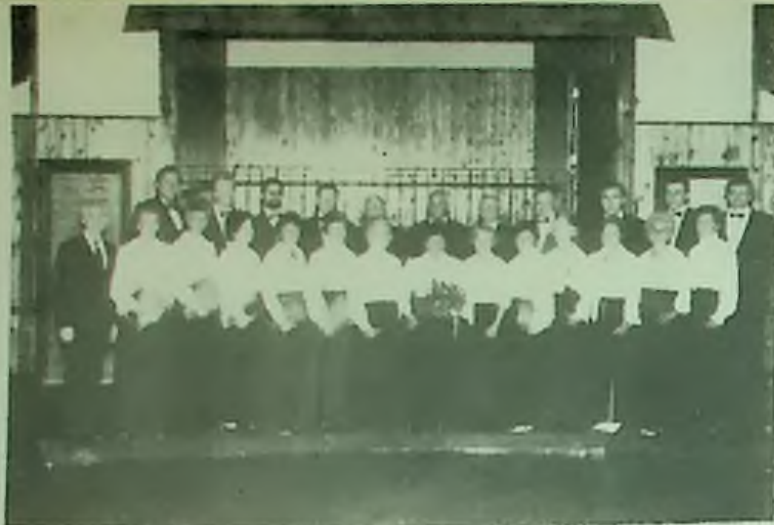
Pěvecký sbor „Velehrad“ v New Yorku.