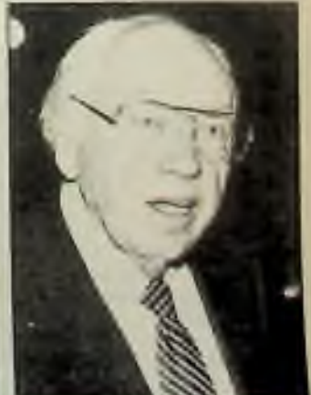
† William Casey, býv. šéf CIA