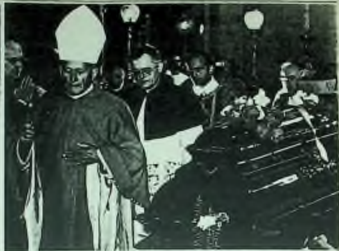
Pražský Ap. administrátor (nynější Otec kardinál arcibiskup) Msgr. Fr. TOMÁŠEK vykonává pohřební obřady.

Poláci si jsou vědomi, že do Krakovska pronikalo křesťanství již z říše Velkomoravské. Ale sem do Velkopolsky lze sledovat jasné stopy počátků kulturního pronikání přes české země a vý-