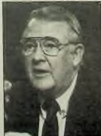
US ministr spravedlnosti E. Meese