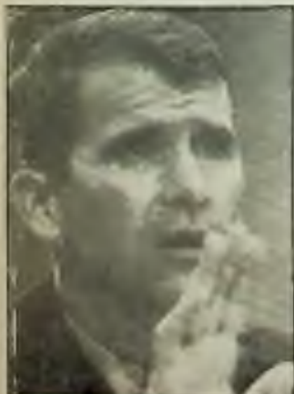
Plukovník Oliver North

Chcete-li pak vědět, proč tzv. veřejně mínění obyčejných řadových Američanů je proti podpoře nikaragujských bojovníků za svobodu, není to vůbec proto, že se mezi sebou hašteří, ale proto, že v samotných USA existuje a pracuje všemi propagačními prostředky Moskvou a US liberály tučně placená „továrna na sandinistickou propagandu a desinformaci“. Je to firma veřejných vztahů „Fenton Communications“, která tak úspěšně v USA pracovala už v době vietnamské války, pak pro komunistické guerily v San Salvadoru a po státním puči sandinistů v Managvě se hned pustila do propagandy ve prospěch Ortegy nejen v USA, ale i v zemích západní Evropy. O tom, jak to pronyšleně dělají, Vám, milí čtenáři, napíšeme příště.