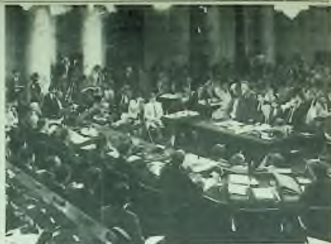
Pohled do zasedací síně kongresního vyšetřování při výslechu plukovníka O. Northa.

Sierra Blanca, Texas. — Nezaměstnaní Mexičané se nadále pokoušejí dostat ilegálně do USA. Dne 2. července US pohraniční stráž otevřela zamčený ocelový nákladní wagon vlaku u Sierra Blanca a našla v něm 18 Mexičanů, kteří se tam zadusili v horku 120 stupňů F; patrně chtěli přijet ilegálně do USA za práci. Pouze jeden