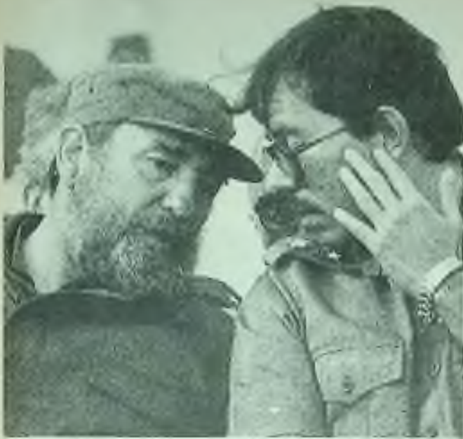
Cožpak ani tento dokumentární snímek dvou soudruhů - Castro a Ortegy - našim paním politikům nestačí, aby rozpoznali, odkud dnes vane vítr nad Nicaraguou?