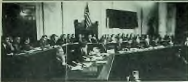
Záběr z vyšetřovací síně v budově US Kongresu.