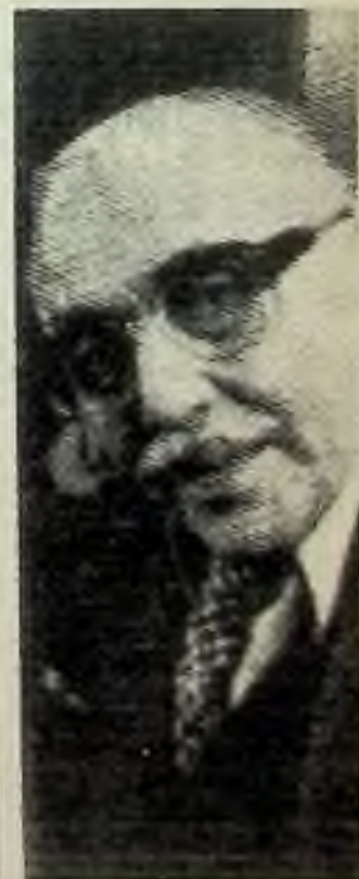
Herec Miloš Kopecký

Zasláno ČTK a zahraničním tiskovým agenturám akreditovaným v ČSSR.