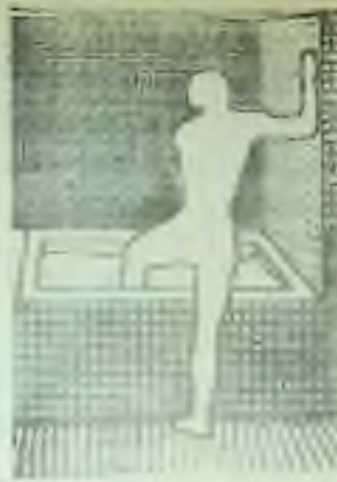
In Bath by Alena Kucerová 1971. Punctured tin-covered metal print.

The Slavic World: Russia and Eastern Europe is planned for Mondays at 6:30 p.m., beginning August 31. For information or to register call IBC 960-1500, ext.400.