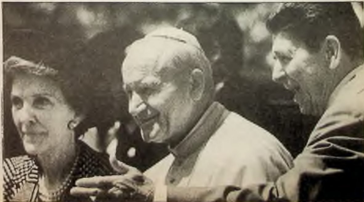
Vpravo: US prezident s chotí Nancy přivítali osobně sv. Otce Jana Pavla II. na mezinárodním letišti v Miami ve čtvrtek 10. září. Při mši sv. v New Orleans v sobotu 12. září.