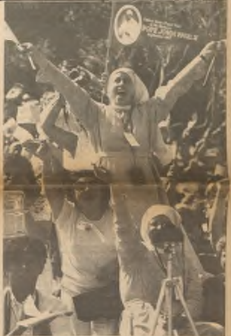
Ve Phoenixu v Arizoně a všude na jihu USA byl papež srdečně vítán s upřímnou radostí.

V San Franciscu pak v misijní basilice „Dolores“ se sv. Otec setkal asi s 60 pacienty smrtelné nemoci AIDS. Mezi nimi byl také pětiletý chlapec, který onemocněl z transfuze nakažené krve. Sv. Otec řekl shromážděným pacientům: „Bůh vás všechny miluje bez rozdílu, ukážete-li jen o Jeho lásku zájem. Boží láska je tak velká, že přesahuje hranice lidské řeči, uměleckého vyjádření i lidského pochopení. Bůh miluje ty, kteří jsou nemocní i ty, kteří trpí kvůli AIDS a podobným neduhům. Miluje příbuzné a přátele nemocných ty, kteří o ně pečují. Všechny nás miluje bezpodmínečnou, nikdy neustávající láskou, kterou nám dokázal na Kříži.“