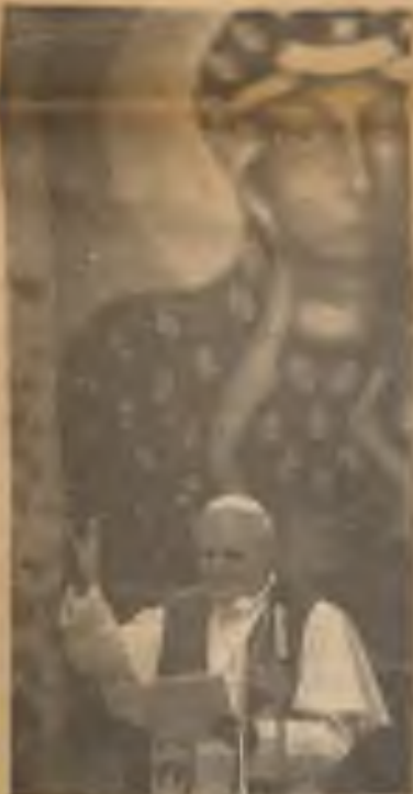
Tentokrát sv. Otec klidně, ale odhodlaně odpovídal svým kritikům mezi t.zv. „pokrokovými“ katolíky USA.

Mezitím před basilikou několik set homosexuálů demonstrovalo proti tomu, že církev je proti jejich homosexualitě „lásce“. Demonstranti však prý