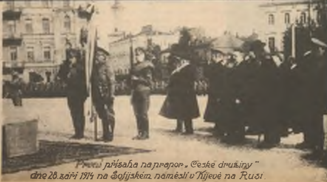
První přísaha na praporek „Česke družiny“ dne 28. září 1914 na Šofijském náměstí v Kijevě na Rusi.

Když naši legionáři ještě v carském Rusku vstupovali do čs. legií, vybrali si k složení své vojenské přísahy věrnosti symbolicky den svátku sv. Václava - 28. září 1914.