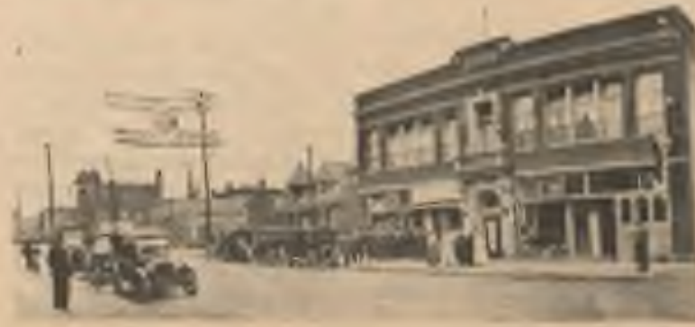
Bývalá budova „Probulov“ v Clevelandu, kde byla v r. 1917 odvodní kancelář pro čs. armádu legionářů.

zůstane nízkou duší i v uniformě vojína. Muž nedobrého charakteru jest nedobrym bojovníkem - a takových v československé armádě nechceme.”