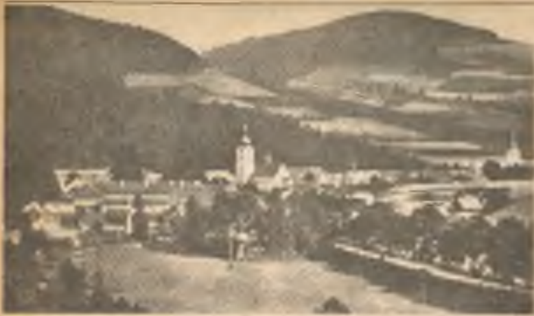
Městečko Jimramov na Českomoravské vysočině: v popředí farní kostel Narození Panny Marie; vpravo kostel cirkve českobratrské.