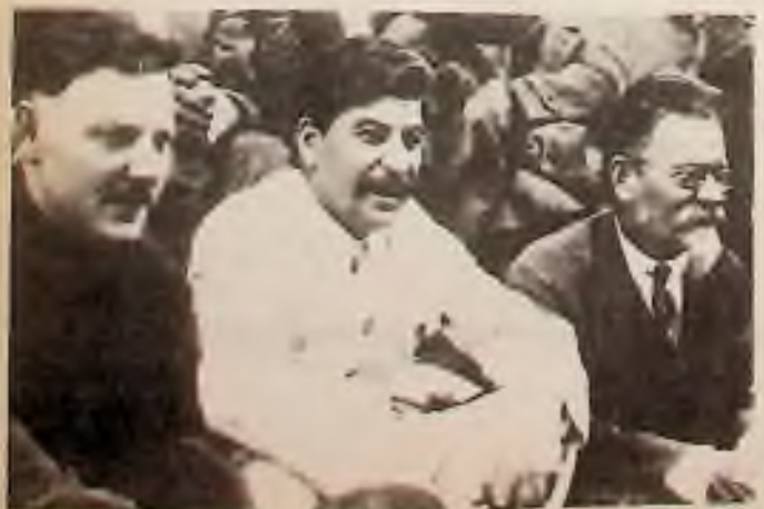
Stalin s Jagodou a s Trockym.

Chceme-li tedy doopravdy a upřímně pomoci svému národu doma k nabytí síly a odvahy dosáhnout opět svobody, nežijme ani v exilu ve lži a hlavně v každodenním životě křesťanský jedneje: v rodině i kolem nás.