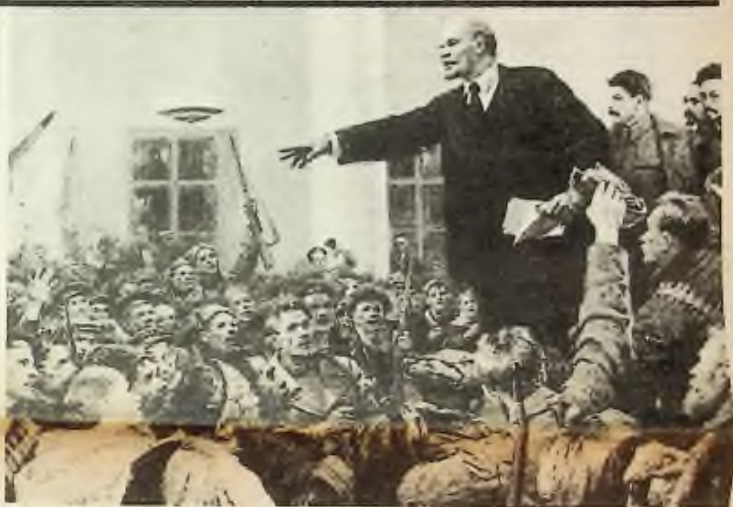
Fotografie známého obrazu V. A. Serova, znázorňující Lenina, když v Moskvě prohlašuje po revoluci založení SSSR.

Dnes, po sedmdesáti letech od „Velké říjnové bolševické revoluce“ všichni víme, jak tato utopistická „vidina“ ve skutečnosti dopadla. Zapříčinila hekatomby mrtvých, potoky krve a slz, a dnes jsou její pokračovatelé - i pod rouškou „Gorbačovovy glasnosti“ stálým, vojensky mocným a nesmírně nebezpečným „Damoklovým mečem“, visícím nad