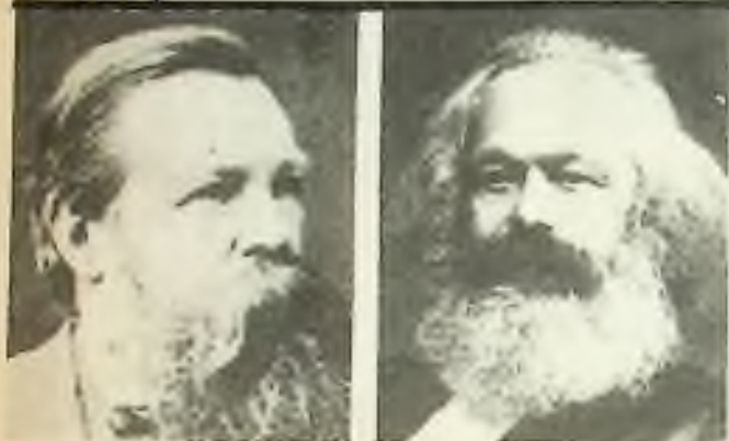
Tito jsou otcové komunismu: Friedrich Engels a Karl Marx

Saturday October 31, 1987 (Sobota 31. 10. 1987)