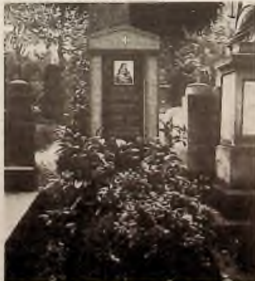
Hrob Elišky Krásnohorské v Praze na Olšanech.