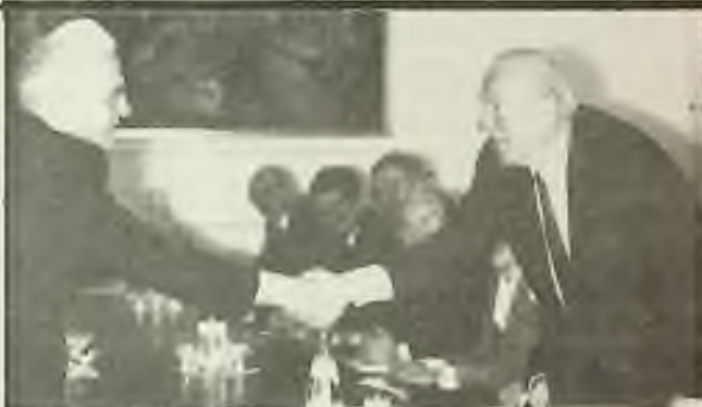
Ministři zahraničí SSSR - Ševardnadze a USA - Shultz se prý tedy nakonec „dohodli, že se dohodnou.“