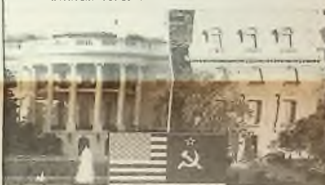
Při vrcholné schůzce R. Reagan - M. Gorbačov se bude samozřejmě také slavnostně hodovat: jednou v Bílém domě a po druhé na starém velvyslanectví SSSR ve Washingtoně.

zmenšení konvenčních zbraní v Evropě se dosud Gorbačov nezmínil ani slovem.