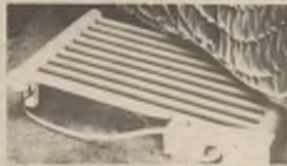
Retail Prices B-1 $187.00 B-2 $135.00 B-3 $119.00

V tom případě si pozorně přečtete tuto výhodnou nabídku a pak si v našem závodě objednejte náš nejnovější tepelný radiátor na elektricky ohřívání oleje. Máme jej na skladě ve třech typech: B-1, B-2 a B-3.