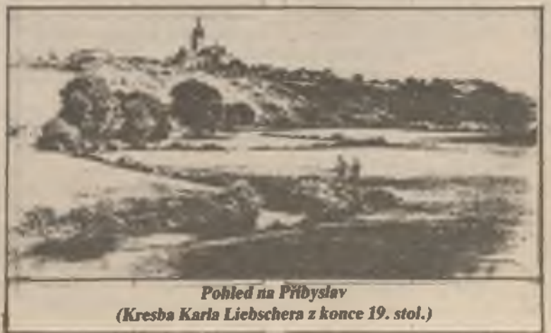
Pohled na Přibyslav (Kresba Karla Liebschera z konce 19. stol.)