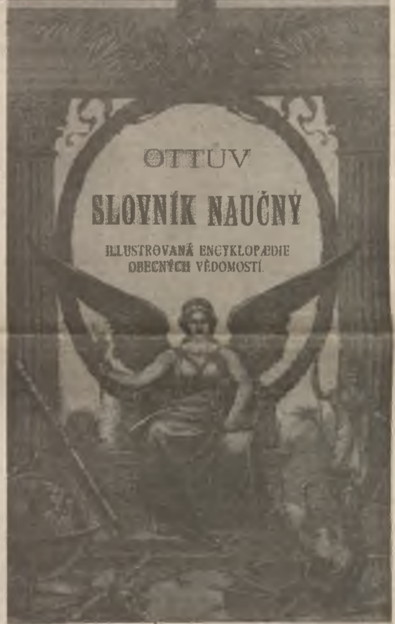
První stránka původního sešitového vydání prvního svazku Ottova naučného slovníku z r. 1888. Že došlo k jeho vydání nikoliv z obchodních, ale ryze vlasteneckých pohnutek, o tom svědčí horní tři zemské znaky českého království: moravské a slezské orlice s českým lvem uprostřed a se svatováclavskou korunou nad jeho hlavou. Pod obrázkem pak stálo: Majitel, vydavatel a nakladatel J. Otto. Tiskem vlastní knihtiskárny v Praze, Karlovo náměstí č. 34.

Jeho zakladatel, vlastenecký tiskař a nakladatel Jan Otto se (Pokračování na str. 6)