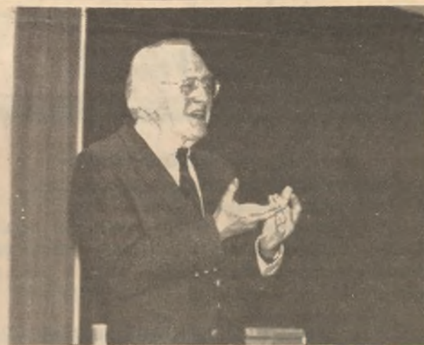
Hudební skladatel prof. Karel Husa při své přednášce na Chicagské universitě 9. února 1988.

„If you are going to present an unfamiliar new score to audiences 12,000 miles away, you had better make certain beforehand that the score is good