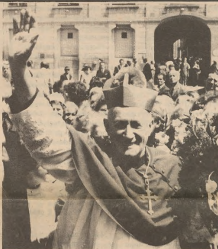
J. Em. Otec kardinál František Tomášek, arcibiskup pražský a primas český.

Svatý Vojtěch, první Čech na pražském biskupském stolci, je mužem evropského významu. Stojí u základů