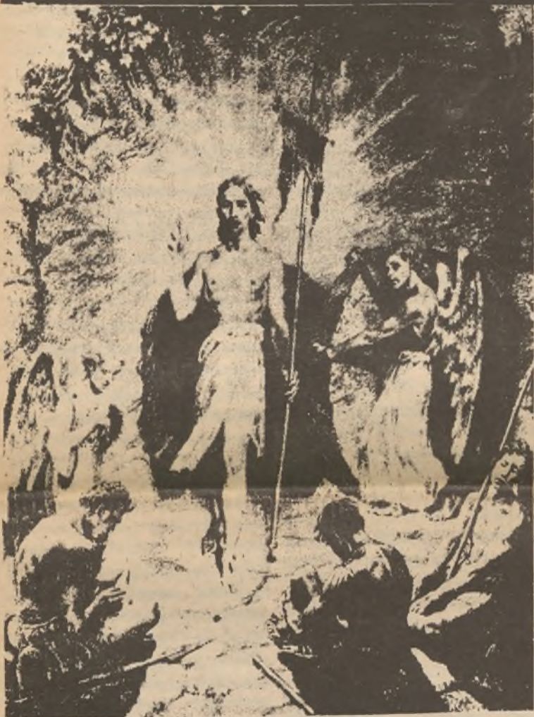
Max Švabinský: VZKRÍŠENÍ

Saturday April 2, 1988 (Sobota 2. 4. 1988)