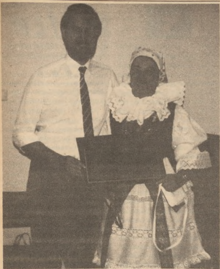
Sourozenci - sestra s bratrem po setkání v Tasmánii - drží diplom státního uznání za dovezený kámen z Českomoravské vysočiny.

plachet. Mezi těmi velkými plachetnicemi proplouly i menší jachty a motorové čluny. Stovky jich tam byly v ty slunné dny v polovici měsíce ledna. Taková námořní přehlídka různých forem i pohonů, kterých se používalo v minulých stoletích, tu byly stovky.