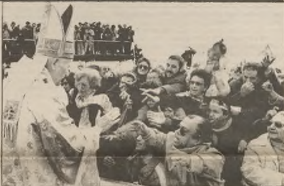
Sv. Otec zdraví urugvajské věrce před mší sv. v pondělí 9. května 1988 na stadionu města Salto. K večerní mši odletel do La Paz, hlavního města Bolívie, kde hodlá navštívit v pěti dnech sedm měst a závazně prohlásit o hrozném a bezpečí narkomanie.

také mnoho lidí bez práce. Sv. Otec ve svém kázání před 50.000 přítomnými mluvil o dělnických problémech, o pracovních uních a sociální nauce církve. Opakoval ideje, které nedávno rozvinul ve své encyklice „O sociálních starostech církve“. Řekl, že žádná dnešní ideologie a žádná politická skupina nedrží monopol na řešení sociálních problémů; žádná existující skupina nemá po ruce všechny odpovědi na problémy práce. Ti, kteří horlivě a obětavě hledají zlepšení životních podmínek dělníků, si zaslouží všestranné podpory. Posláním církve není předávat lidstvu vypracované ekonomické a sociální systémy ani návrhy na technická řešení dělnických problémů; posláním církve je hájit nutnost sociální spravedlnosti a upozorňovat na mravní nedostatky dnešního sociálního řádu. V našem světě je nespravedlivé rozdělení bohatství a statků, a ti, kteří vlastní pozemky a jiné druhy majetku, mají povinnost užívat svého bohatství tak, aby bylo ku prospěchu i ostatním lidem. Sv. Otec také několikrát citoval svou encykliku o dělnických problémech z roku 1981; přítom