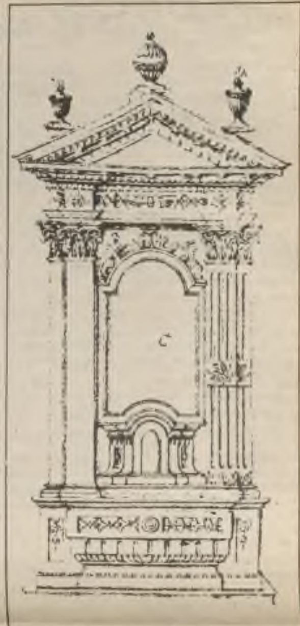
Návrh kazatelny nad zpovědnicí.