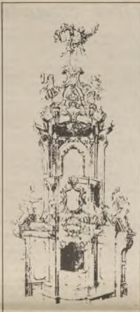
Návrh emirového oltáře

Devoty začínal v duchu hutného baroka. Jeho práce z mladších let se vyznačují dokonalým zvládnutím draperií a gest, typických pro vrchol barokního stylu v Čechách. V pozdějších letech se přikláněl již k empirismu, jak vidíme na obrázku navrhovaného oltáře z roku 1801, určeného pro chrám sv. Ducha - (je uložen v UMPRUM museu v Praze). Ostře se liší např. od návrhu kazatelny, komponované jako archy nad zpovědnicí, který pochází z let okolo 1760-65. Podle datování dosti přesně zjištěného je vidět, že tento pilný řezbář pracoval až do nejposlednějších let svého bohatého života. Narodil se 11. VI. 1738 a zemřel v Hradci Králové, jak již vzpomenuto, roku 1817.