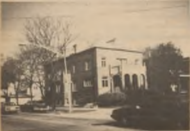
Takto vyhlíží nová budova chicagského „Velehradu“ (bývalý konvent benediktinských sestřiček učitelek) - v Ciceru na 61. Avenue. Bude v ní i kancelář Svazu českých katolíků, redakce a vydávatelství Hlasu národa, přednášková a spolková místnost s krásnou kapličkou, bydlení pro kněze a případné hosty.