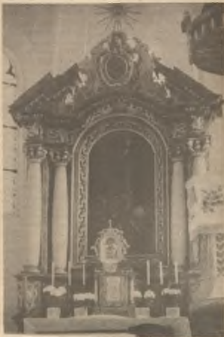
Hlavní oltář v honbickém kostele.