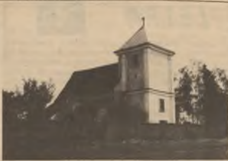
Kostel Povýšení sv. Kříže v Honbících stojí uprostřed hřbitova a celý areál je ohrazen zdí...

Opravdu neměli to ti naši předkové lehký život! Jen v ojedinělých případech dodržovaly vrchnosti zákonem stanovené robotní normy, ale vyžadovaly stále více práce a ukládaly těžší povinnosti, až se ta břemena stávala neúnosná a lid se bouřil. Teprve za vlády Marie Terezie došlo k částečným úlevám. Její syn císař Josef II. zmínil podstatně robotní povinnosti, ale jeho předčasná smrt 20. února 1790 zavinila, že k úplnému osvobození z poddanství a zrušení roboty došlo až 7. září 1848, tedy letos právě před 140 léty. Když již vzpomínám Josefa II. chci zde též zaznamenat, že císař ten v r. 1778 navštívil zdejší okoli a poručil stavět vojenskou opevnění 2 km západně od Honbic na kopci u Tří Bubnů okolo kostela sv. Jiří.