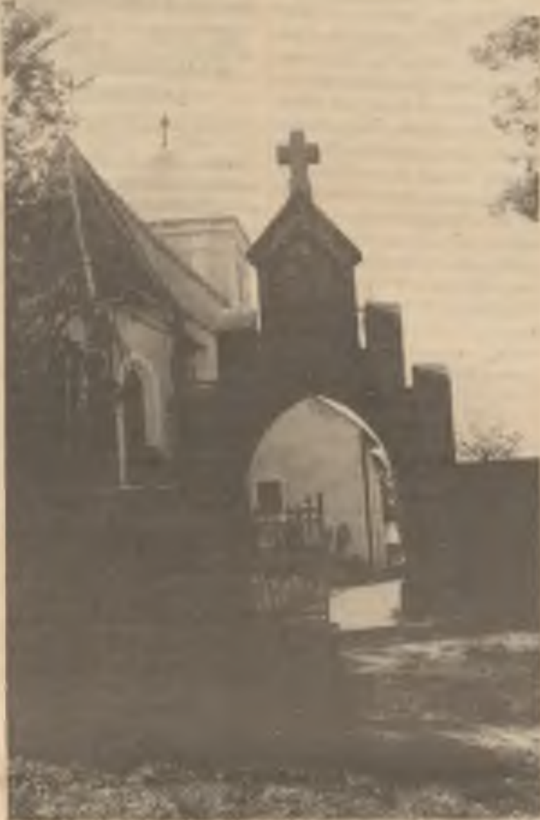
Vstupní brána na hřbitov.

Tri sousedící vesnice dnes přifařené do Hrochova Týnce sdílely v minulosti společné osudy. Sou to vedle Honbic, Nabočany a Libanice. První bezpečné zprávy z těchto míst se nám dochovaly a Dlubňanův z