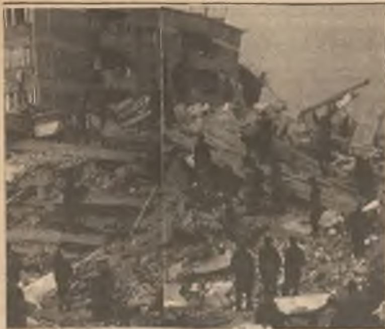
Ledabyle postavené stavby se v Leninakenu zřítily jako baráčky z karet a členové Rudé armády jen dohlížejí na to, jak ti druzí pracují...

glasnosti a perestrojky řekl, že každý, kdo by se domníval, že jeho reformami má být komunismus nahrazen, utíkal by od reality. I ta jeho glasnost zůstává stále stejná; velkolepá slova, do očí bijící gesta, kosmetické úpravy, snaha o zlepšení sovětské špatné pověsti ve světě k získání západního kapitálu a technické pomoci, avšak komunismus tu zůstává, i se svými cíli. Žádné větší skutky pro změnu komunismu - mimo Mad'arsko - prozatím nikde vidět nejsou. Doufejme jen, že velké řečnění a okázalá gesta nepomohou Sovětům získat další „užitečné idioty“.