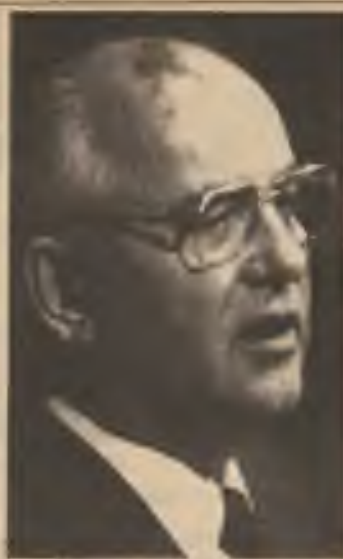
M. Gorbačov při své řeči v OSN.

o závažném a v budoucnu jistě historickém projevu novoapečeného presidenta SSSR soudruha Michaila Gorbačova před Valným shromážděním OSN ve středu 7. prosince 1988 v budově Organizace spojených národů v New Yorku.