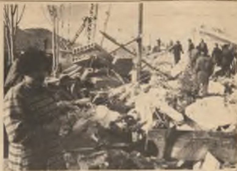
Zříceniny domů v arménském městě Leninaken.

„Kostky jsou vrženy.“ - Rozhodl je pro Západ stále ještě záhadný sovětský marxista M. Gorbačov. Budou s ním západní demokracie schopny hrát jeho hazardní hru?