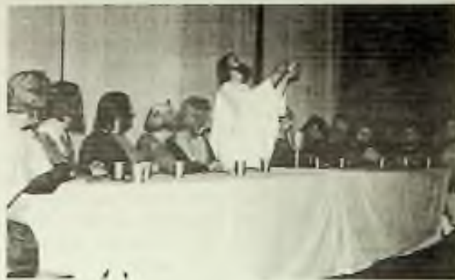
Ježíšova poslední večeře s dvanácti apoštolý.