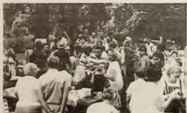
Radostné společenství našich krajanů na letním pikniku.