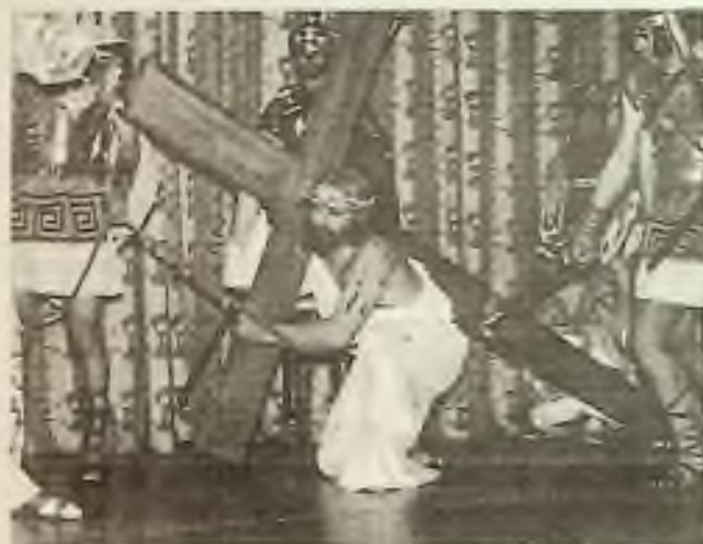
Ježíšova křížová cesta a jeho pád pod křížem.

Klub Domov pracoval a dosud pracuje především v oblasti chicagské, kde byl založen. V jiných státech a městech USA pokračovaly a pokračují v práci zakladatelů Distriktní svazy českých katolíků clevelandský, kalifornský, texaský a newyorský, které jsou dosud velmi činné.