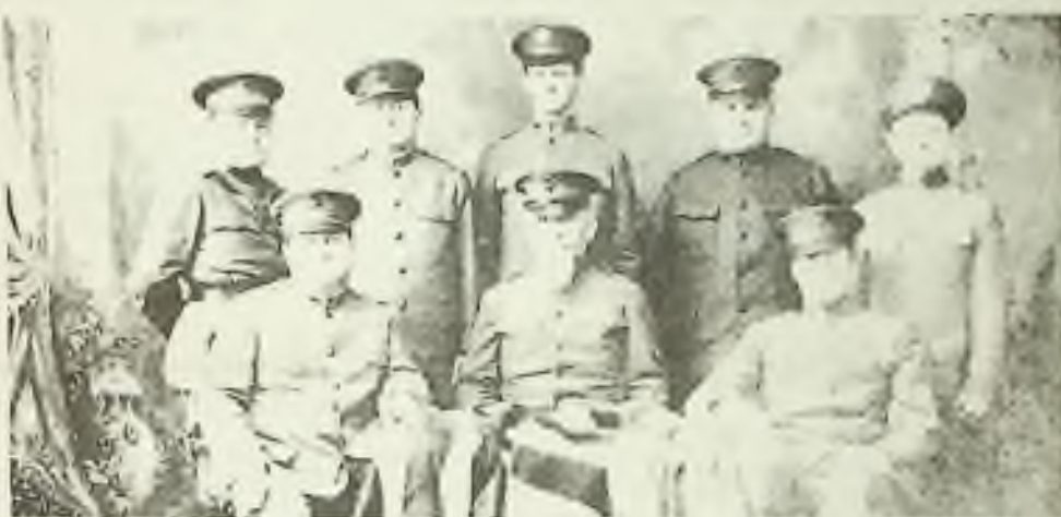
Druhá mise Národního svazu českých katolíků vyslaná do Československa v listopadu 1919.