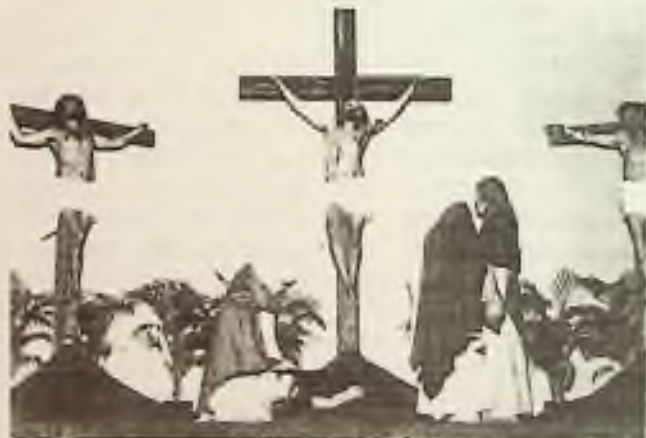
Ježíšovo ukřižování a smrt na Golgotě mezi dvěma zločinci.