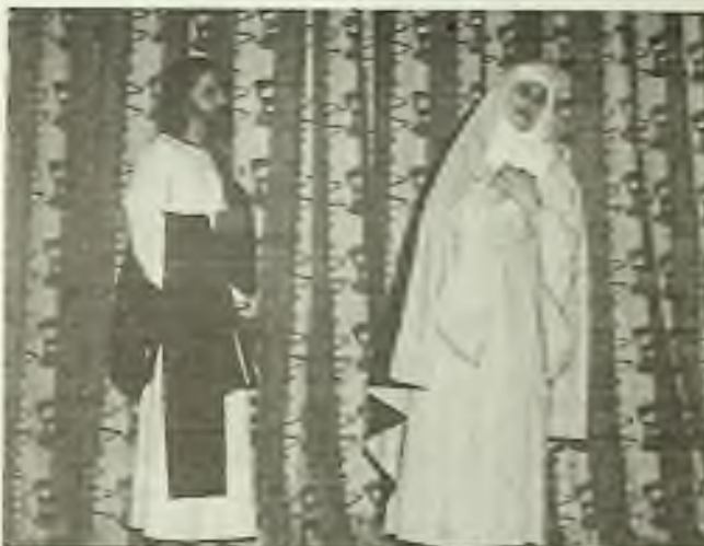
Ježíš potkává svou matku Pannu Marii.