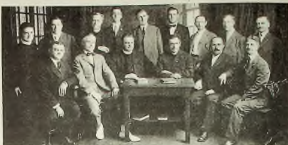
První výkonný výbor Národního svazu českých katolíků 1917 – 1918.

Po druhé světové válce 3.září 1946 opatství sv.Prokopa v Lisle, Illinois vyslalo misi svých řeholníků, členů Národního svazu českých katolíků do starobylého benediktinského kláštera v Broumově na pomoc při jeho obnově. NSČK od začátku pomáhal budovat římské Nepomucenum, seminář našich bohoslovců, a dodnes členové s příznivci Svazu svými velkodušnými dary pomáhají udržovat jeho plynulý chod.