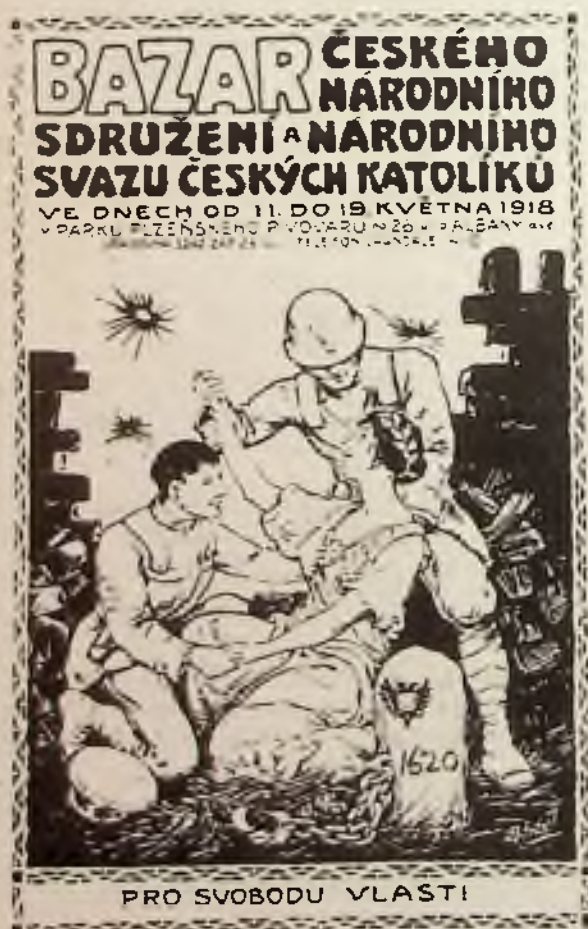
Leták propagující sbírku na pomoc staré vlasti.