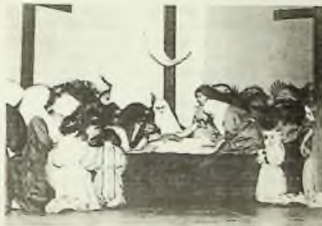
Ježíš snát z kříže a položen do hrobu.