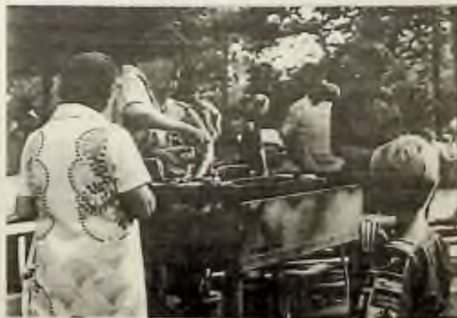
Ženy připravují oblíbené pochoutky a piknikové speciality.