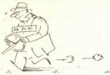
„Závidím lidem s takovou fantazií!“