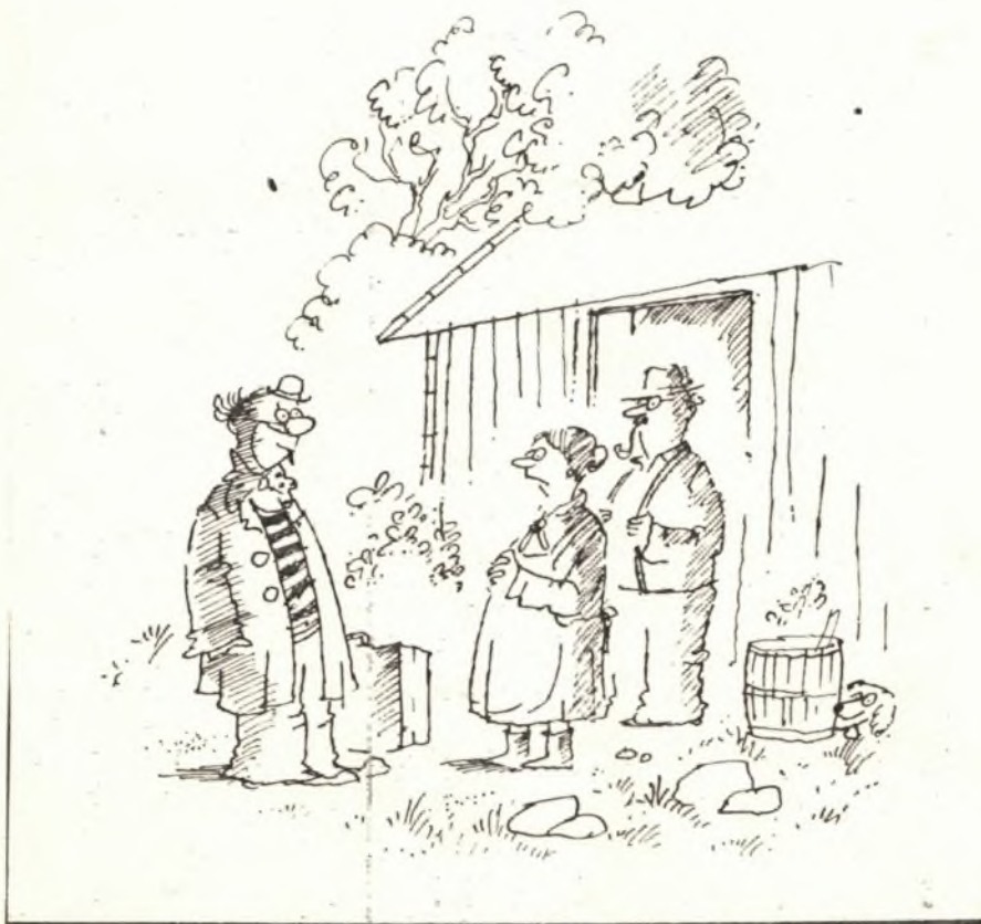
„Dítě nešťastný! Vždyť jsi nám psal, že se ve městě živiš filozofií!“