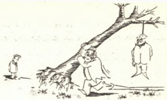
„Hola! Kudy k lékaři?“