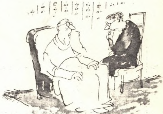
„Než zavřu oči navždy, musím se ti, Žofie, s něčím svěřit: celá ta léta jsem tě klamal se zahraničními rozvědkami.“