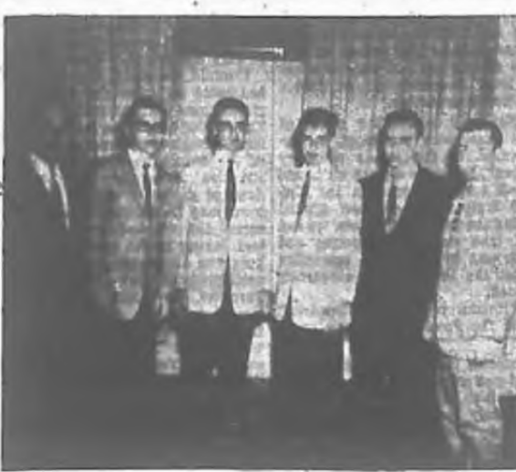
Members of the runner-up team of the Andrew Hlinka Okres Basketball League, the Carroll Township Bears.