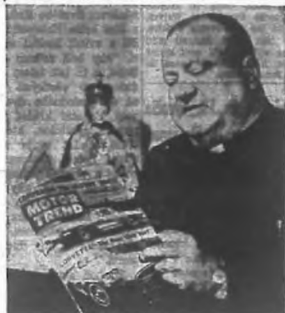
In his study he pores over automotive and scientific periodicals in search for stimulants to his inventive mind.