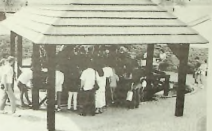
Součástí Horáckého Muzea v Novém Městě na Moravě je "Mlejnek z vřru". Poháňný mlýnskýjím kolem uvádí v pohyb stovky figurek, které se zabývají různými řemesly. Je to počítaná pro děti.