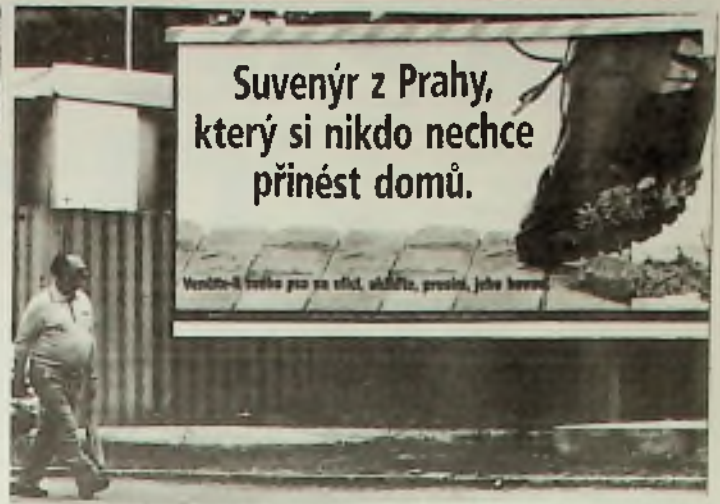
Celkem neradi přinášíme tuto tabuli z pražských ulic, ale s počtem psů si Praha noví rady a turisté si stěžují. Kolik těch psů vlastně je, nikdo neví..