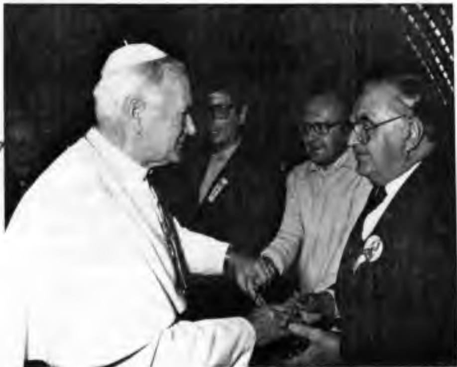
ŘÍM - 13. LISTOPADU 1990. VLEVO OTEC KARDINÁL FRANTIŠEK TOMÁŠEK.

vzrušením by stačily pro každého normálního smrtelníka, nikoliv však pro Václava Hynara. Po 22 let, každý čtvrtek nám vysílal česky na stanicích WZAK a WSSB „Hlas českého Clevelandu“ od 6 do 7 hod. večer. Byly to nejenom zprávy z naší krajanské veřejnosti, ale seznamoval nás o událostech ve světě a hlavně nás burcoval a hrál krásnou českou hudbu.