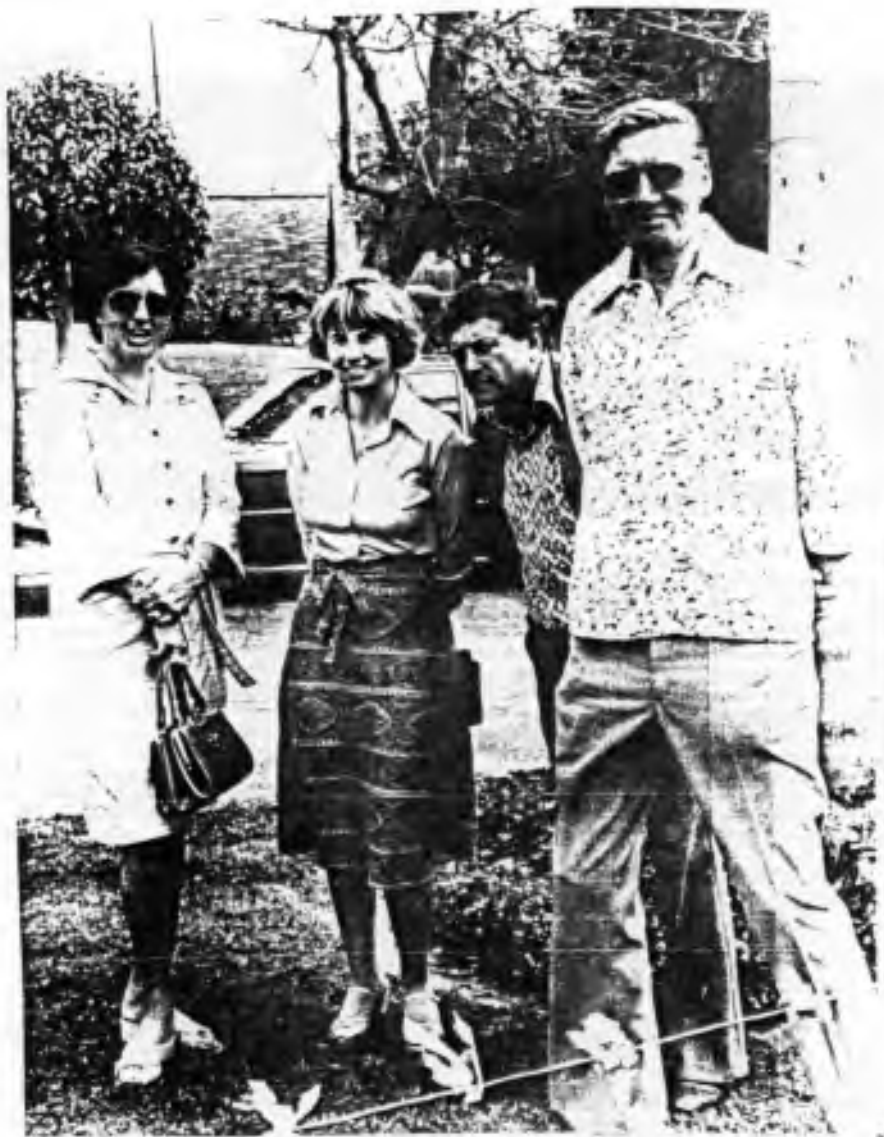
OTO - L.P.I. PHOTO

Milí přátelé, jestliže se vám podaří správně identifikovat rozesmáté tváře na hořejším obrázku, máte možnost vyhrát hodnotnou knihu. To jest zašlete -li nám do konce března odpověď na adre- su: AOJP, P.O.BOX 66453, LOS ANGELES, CA 90066. Všechny odpovědi budou vylosovány a výherce odměněn knihou! Hodně štěstí!