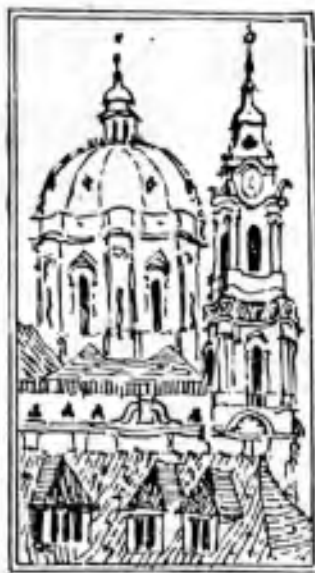
CHRĀM SV. MIKULÁŠE

Devín tak! — Hrad Devín ožil duchem velké tradice, oslavami státního svátku na počest našich věrozvěstů a spolupatronů Evropy sv. Cyrila a Metoděje. V malém amfiteatru pod hradem měla přes malý zájem Bratislavanů přesilu slovenská vláda v čele s předsedou Janem Carnogurským a celá reprezentace Slovenské národní rady. Oslavy probíhaly i v Nitre, kde se konala pod holým nebem pontifikální mše a veřejnosti zde byl poprvé předveden unikátní archeologický nálezk slonovinové pyxidy pocházející z darů a církevních relikvií byzantské mise sv. Cyrila a Metoděje.