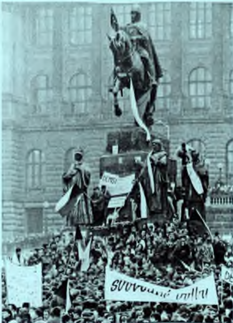
Svobodné Volby, free elections, is the banner's cry in Prague's St. Wenceslas Square during November 1989 demonstrations.