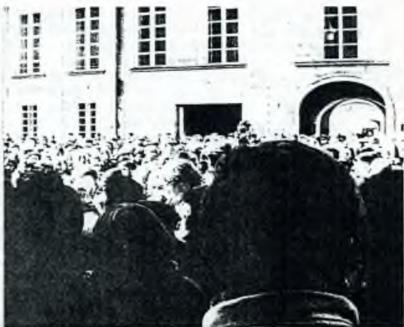
Věřící, kteří se nevešli do chrámu sv. Víta 6. března, stáli na nádvoří. Slavnostní mši sloužil kardinál Tomášek.

svobodě. Mínění občanů samých je však jiné. Starší lidé mají ještě dobře v paměti, jak komunisté po roce 1948 nevybíravými mocenskými prostředky útočili proti kněžím, laikům a věřícím. My všichni víme, jak působila a působí škola, jakou protináboženskou často doslova propagandu vede. Velmi dobře známo je, jak zlá situace je v obsazení diecézí biskupy. Představitelé státu nejsou ochotni respektovat stanovisko Vatikánu. Do záležitostí církví, asi nejvíce katolické církve, se zbytečně, necitlivě a v rozporu s proklamovanou odluhou, vměšují a zasahují. Typickým příkladem této praxe