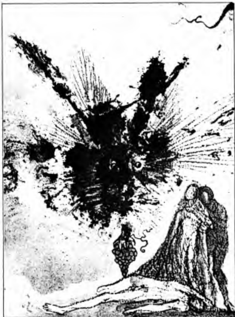
Noe, „Když sedneš k jídlu s pánem, piňně šetř, co jest před tebou. Jinak vrazil bys nůž do hrdla svého, byl-li bys lakotný.“ (Kniha přísloví, kapitola 23)