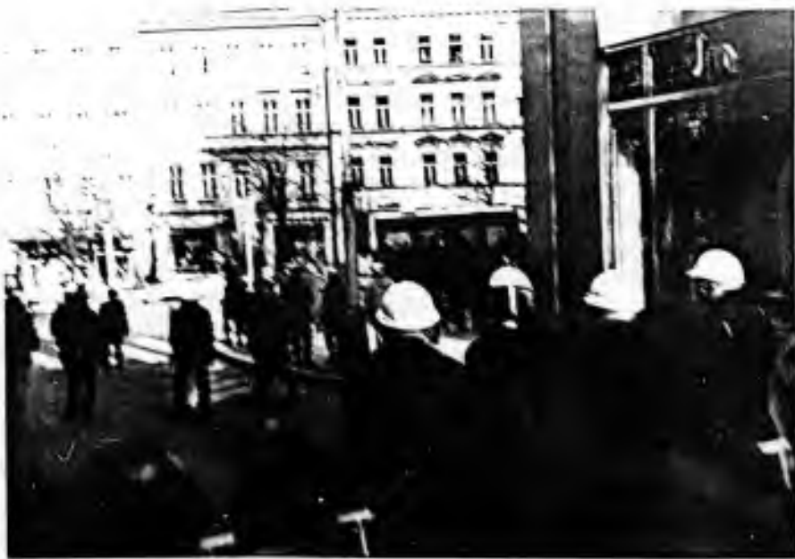
Připomínka lednové ulice

ta. Skutečný předěl znamená Iniciativa kulturních pracovníků. Početná skupina oficiálně etablovaných a mnohdy skutečně špičkových a uznávaných umělců spolu s některými tvůrci "v nemilosti" a mnoha pracovníky v kulturní oblasti se postavila za Václava Havla. Stejně stanovisko jako ona zaujali rovněž mnozí další lidé, vědci, dělníci, studenti atd. Žádali propuštění nejen Havlovo, ale všech politických vězňů. Ti, kteří jednali, nehledě na možná rizika, kritiku nebo ignorování mocných, v souladu se svým svědomím, zasluhují vy-