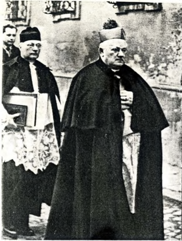
J. E. nřdp. arcibiskup Dr Karel Matocha se ubırá do metropolit- ního chrámu sv. Václava v Olomouci k slavnostní instalaci nových dómských prelátů.