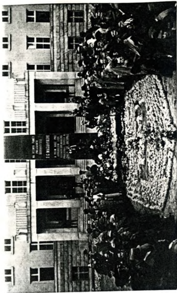
Žižkovo nám. v Olomouci když a nyní