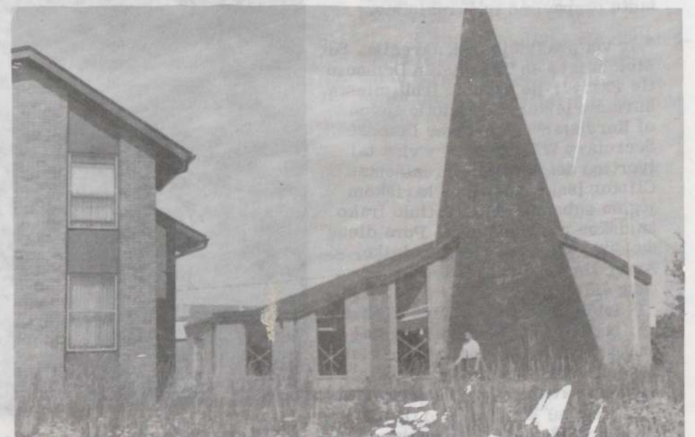
MELSKIMĖS UŽ TĖVYNĖ