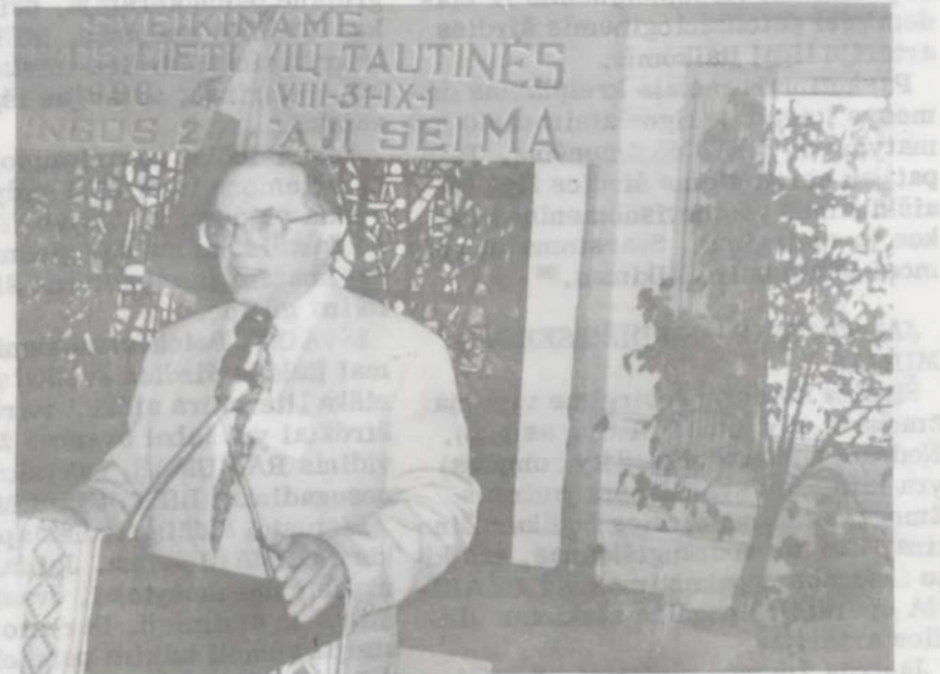
Lietuvos Seimo narys, Lietuvių tautinės sąjungos veikėjas Leonas MILČIUS kalba ALT S-gos suvažiavime Čikagoje rugpjūčio 31 d.