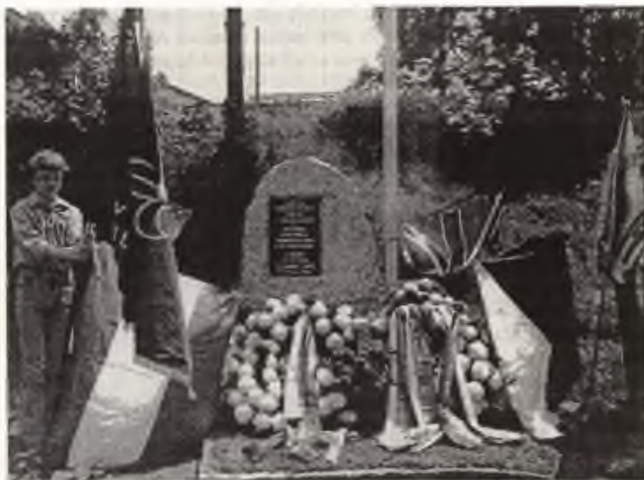
Čestná stráž skautů v Altnagelbergu