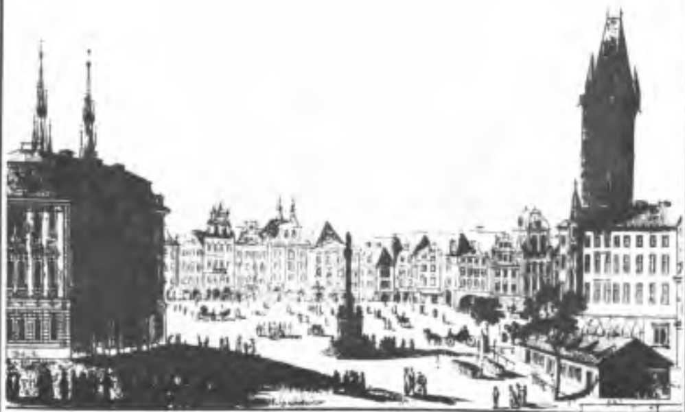
Die Aussicht der großen Plätze der Tschechischen Altstadt Prag, wie sie hier von der Mittel- nachts-Seite, am Mittag anzusehen ist.