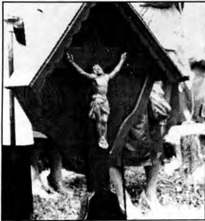
Hromadný hrob vězňů na jáchymovském hřbitově

Týden bude zakončen akcí KPVČ Jáchymovské peklo.