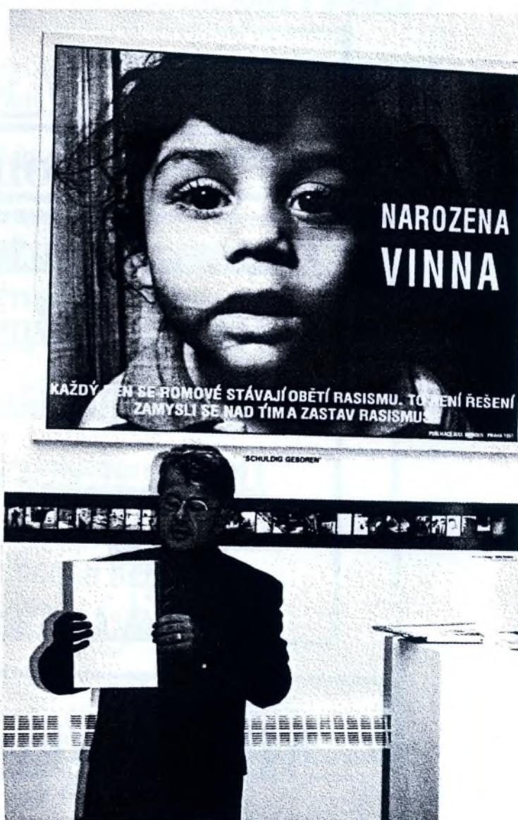
Starosta Janssen (Hoorn) na výstavě projektu TOLERANCE v Den Haagu, září 1997

Takové komise většinou nic konkrétního nesvedou, ale je to aspoň začátek: přiznání, že je třeba se daným problémem skutečně zabývat.