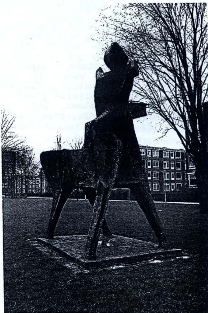
▲ Marino Marini Jezdec, 1958