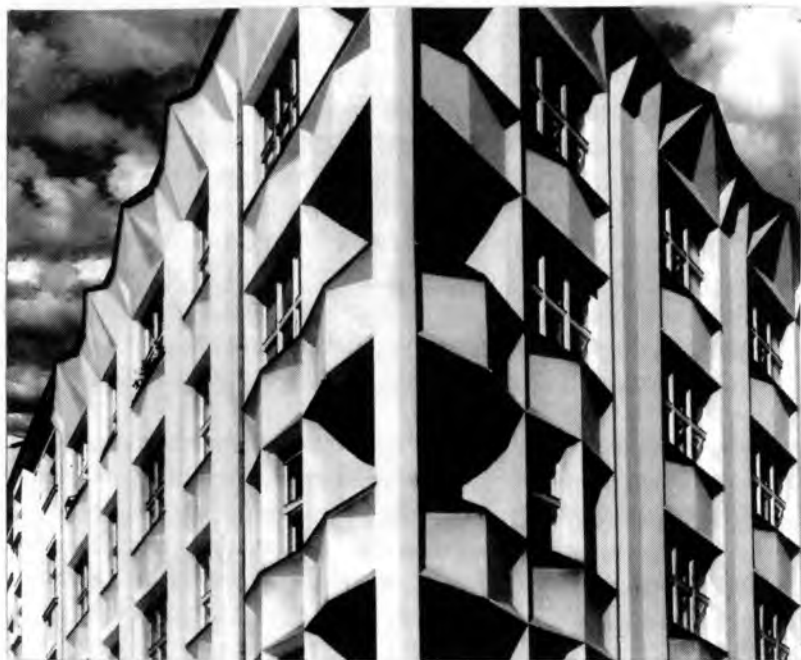
Kubistické domy pod Vyšehradem, Praha 2 (1912-1914)

Dynamiku dvacátého století zastupuje stříbrná tatra světoznámého cestovatelského páru Hanzelka – Zikmund. U východu z expozice pak budou instalovány tři obrazovky, na nichž se v krátkých, spíše klipových sekvencích připomenou současné vývojové tendence české architektury. Tyto tři obrazovky budou mířit ven z expozice jako pomyslná šipka ukazující do třetího tisíciletí.