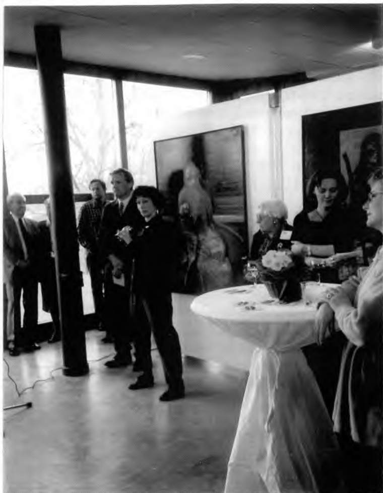
Záběry z výstavy v Delftu