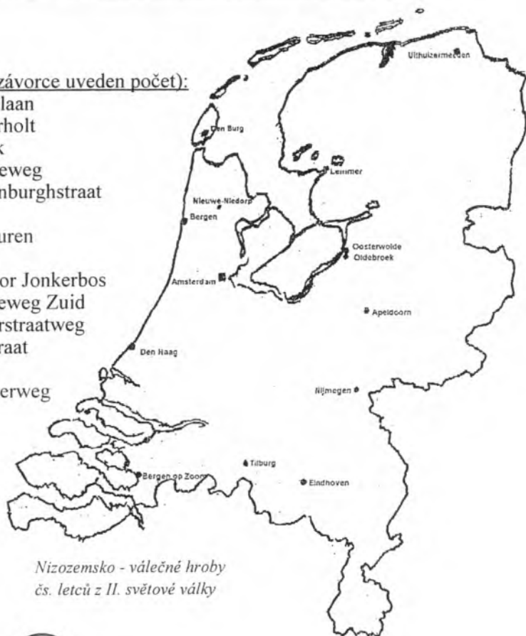
Nizozemsko - válečné hroby čs. letců z II. světové války

Oorlogsgravenstichting (Netherlands War Graves Foundation) Zeestraat 85, 2508 CR Den Haag