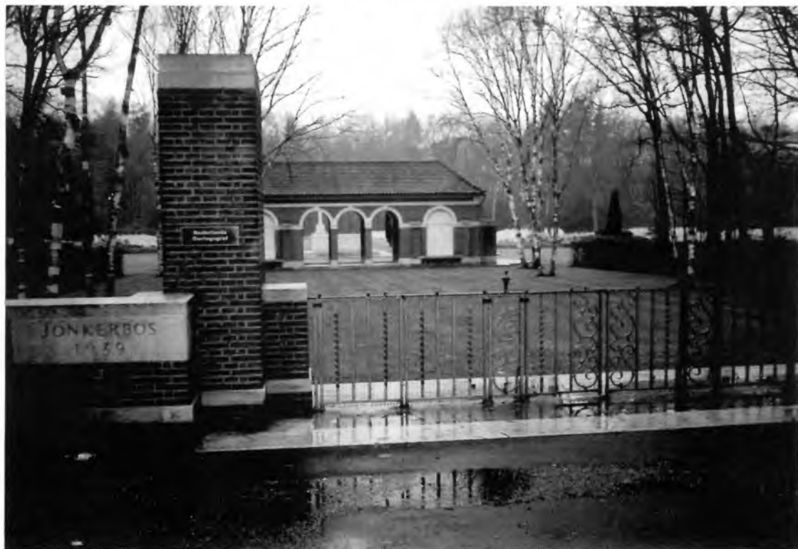
Britský válečný hřbitov Jonkerbos v Nijmegen

hřbitově. V loňském květnu jsme podobnou akci zorganizovali v obcích Oldebroek a Oosterwolde nacházejících se nedaleko malebného pevnostního města Elburg. Konečně, v květnu 1999 jsme tuto připomínku zahájili v Bergenu op Zoom na tamním rozlehlém a důstojném britském válečném hřbitově. Snad jsme tímto krokem položili základ budoucí tradice, která se snad ze skromných začátků stane pravidelnou a známější součástí česko-nizozemských vztahů. V průběhu dalších let by tak měla přijít řada na další lokality, na které se z naší strany dosud nedostalo. Podobně postupují i Britové, kteří každý rok také navštíví jen několik málo z více než 450 míst, o která pečují. Pokud by některý ze čtenářů Nizozemských listů chtěl na některém z těchto míst zastavit nebo zjistit více informací, níže jsou uvedeny příslušné adresy.