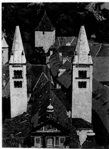
Klášteř sv. Jiří, Praha 1 –Hrad (10. století)

Oproti vznošené a vertikální architektura dojem tíhy, kleneb je rozkládána do šířky a obvodové zdi a poměrně úzká. Nejčastěji dochovanými románského slohu jsou kostely, související s křesťanstvím, jež upevňovalo svou pozici. také zbytky dobových hradů, dvorů.