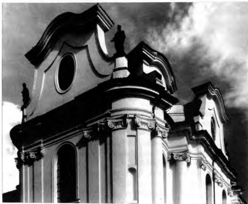
Kostel sv. Markéty, Praha 6 – Břevnov (1708-1712)

V baroku opět získávají na důležitosti a slohové přiznačnosti stavby církevní, zejména kostely. Rozvíjí se však i architektura světská (zejména zámecká a parková). Jistou novinku představuje velký rozvoj a význam architektury venkovské a lidové.