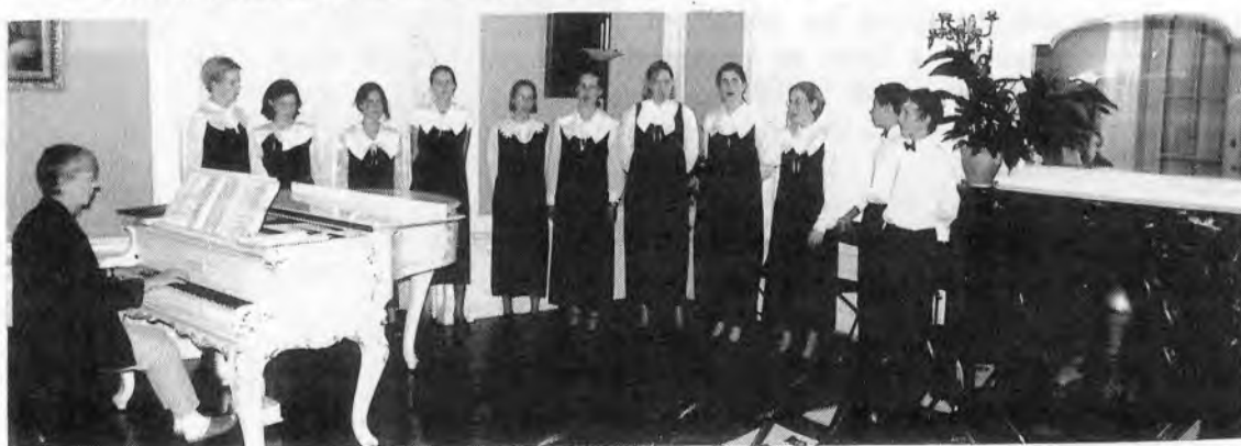
Dětský pěvecký sbor Klíček – koncert 31.5.2001 – rezidence v.v. Den Haag