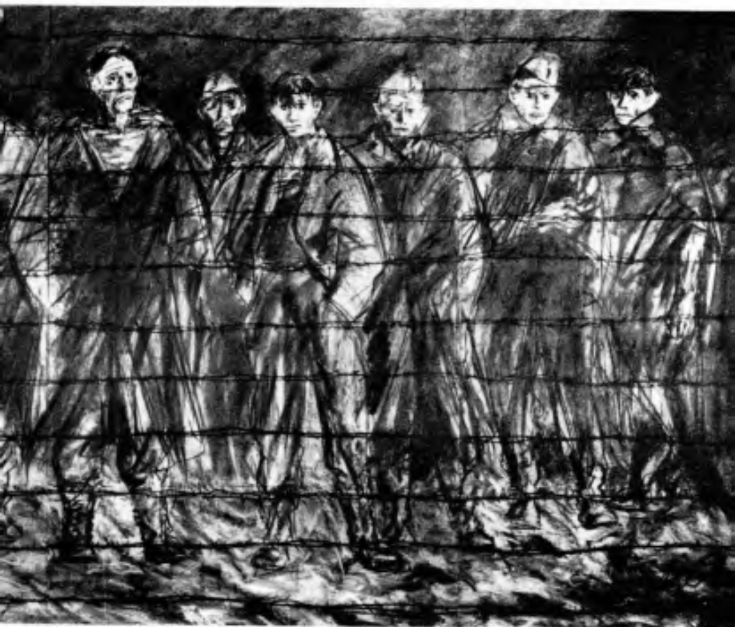
Charles HUG: Hinter Stacheldraht Wandbild zum Thema «Kriegsgefangene» für das Internationale Komitee vom Roten Kreuz «CICR» in Genf.