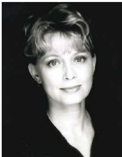
článek o paní Sittě nebo jim pohrozili jáchymovskými

obyčejných, dělníků, rolníků a úředníků otroky a dali jim vějičku šťastných zítřků