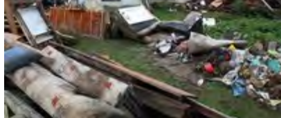
Autor: Jan Langer At noon local radio announces the names of those

Soldiers are still collecting the remains of dead poultry that water carried around.