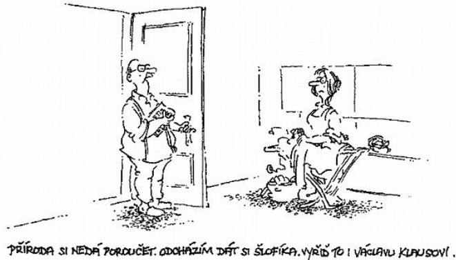
PŘÍRADA SI NEDA POROUCĚT. DOCHÁZÍM DÍT SI ŠLOFÍKA, VYŘÍDÍ TO I VÁCLAVU KLAVUSOVÍ.

thatcheristy typu Farage, tak tradiční konzervativce jako Philippe de Villiers. V řadách této frakce se rozhodně fašisté nenacházejí, přičemž samotná preambule frakce totalitní ideologie jednoznačně odsuzuje.