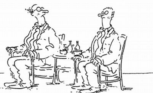
NEPŘÍTE K MAGORŮM, KTERÍ TVRDÍ, ŽE HOSPODÁŘSKÁ KRIZE JE NÁS NEDOTKNE ?

s.80.2 Sedition (Pobuřování): Urging a person to assist the enemy (7) A person commits an offence if: (a) the person urges another person to engage in conduct; and (b) the first-mentioned person intends the conduct to assist an organisation or country; and (c) the organisation or country is: (i) at war with the Commonwealth, whether or not the existence of a state of war has been declared; and (ii) specified by Proclamation made for the purpose of paragraph 80.1(1)(e) to be an enemy at war with the Commonwealth. Penalty: Urging a person to assist those engaged in armed hostilities (8) A person commits an offence if: (a) the person urges another person to engage in conduct; and