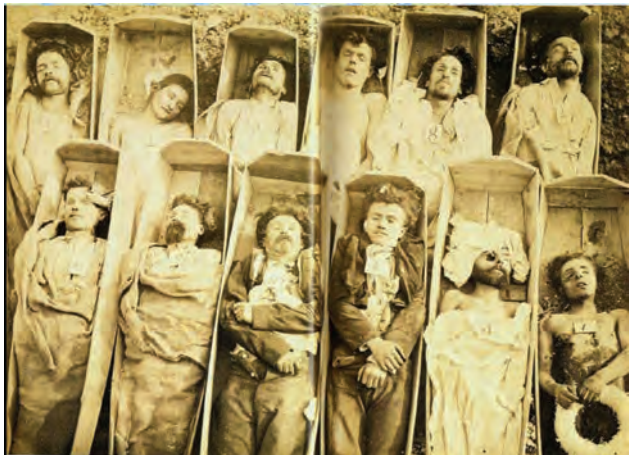
Mrtví komunardi v rakvích popravení při povstání v Paříži. (21. května 1871)

Dvanáct prostých rakví stojí vedle sebe, v každé z nich je mrtvola muže. Vybledlý snímek připomíná krvavý konec Pařížské komuny, revolučního hnutí, jehož vůdci na jaře 1871 dva měsíce snili o spravedlivějším světě. Do dneška zůstává záhadou, co znamenají čísla na mrtvolách popravených komunardů.