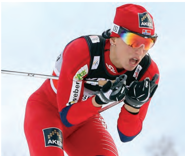
Astma, předmět sporu

Jako by byl pro ni Liberec zakletý. Před třemi lety odtud odjížděla ze světového šampionátu zdrčená a na hlavu poražená, doma ji odepisovali. To však byl poslední temný moment v kariéře tmavovlasé Norky. Olympiádě loni kralovala a v této zimě byla báječná.