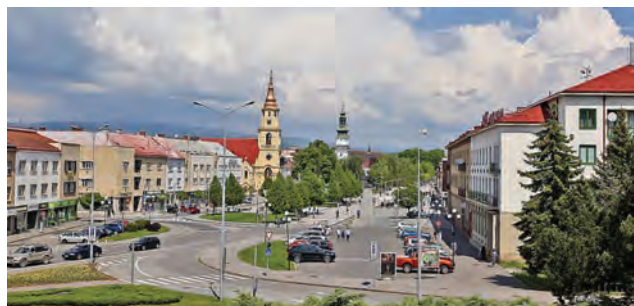
Novy Cas sk