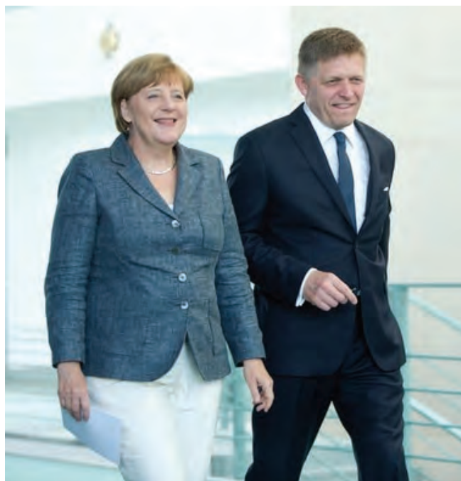
Merkelová a Fico

Prvé predsedsnícke kroky Slovenska v každom prípade úzko súvisia so zajtrajším referendom o Brexite. Viac o tom, čo môžeme očakávať v oboch alternatívach výsledku, sa dočítate už zajtra v denníku Plus JEDEN DEŇ.