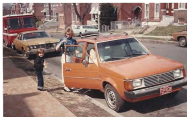
. Pred našim domom na 2008 Chippewa street s našim oranžovým Dodge.

Ináč naše prvé auto v Amerike bol 1974 Ford LTD, hováďo skoro 6 metrov dlhé (zralo to tusim 20 litrov na 100 km ale benzín bol veľmi lacný) my sme ho kupili tusim za 300 dolarov, druhé bol 1977 Ford Mustang (500 dolarov) tretie bol oranžový 1979 Dodge Omni za $1.300 (v Európe bol známy ako Chrysler Horizon).